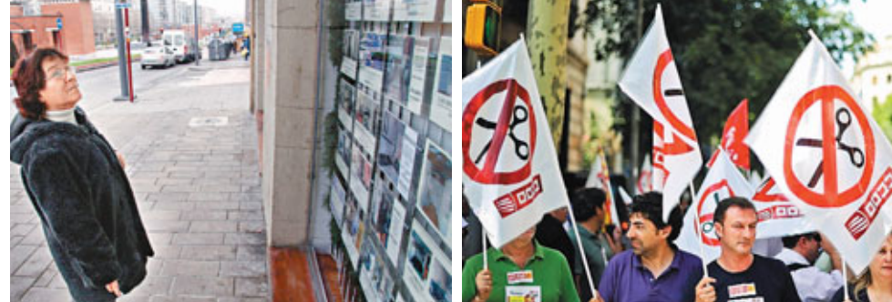
西意經濟成隱憂，民眾經過地產代理只能望而輕嘆(左圖)。右圖為西國反緊縮示威。