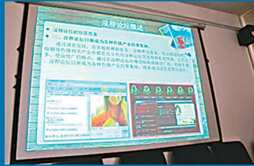
警方正在分析案情。