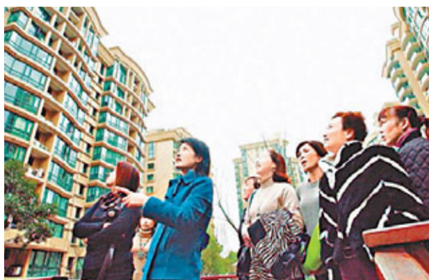
叱咤全國的「溫州炒房團」,在本輪房地產調控中有可能全軍覆沒,太太購房團是溫州炒房團的特色之一。

信息來看,國務院督查組對湖南、湖北、河北、江門存在的問題,已經是毫不留情,直言不諱了。「這次有督查組還對一些房地產『陋習』提出質疑。例如商業立項的商住項目,以前可以挖坑就預售,這次被提了出來。另外,開發商預售之前的審審,也有人提出了質疑。」上述人士向記者說。「各個督查組只負責提出建議和意見,但最終政策的取捨,還是要由住建部等相關部委牽頭決定。」