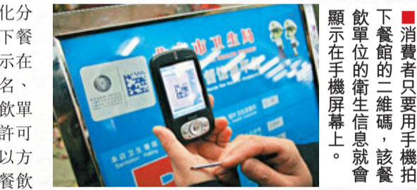
■ 消費者只要用手機拍下餐館的二維碼，該餐館的衛生信息就會顯示在手機屏幕上。

公共場所空氣質量可遠程監測 海澱區衛生局衛生監督所選對在線監測系統進行了進一步擴展，啟動了公共場所空氣質量遠程監測系統，共在大商場超市、學校圖書館、影劇院等人羣密集公共場所設置監測點26處，監測指標包括溫度、濕度、風速和二氧化碳。