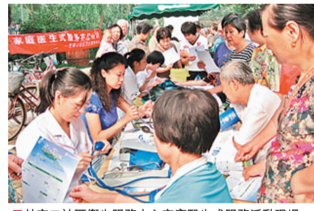
■ 甘家口社區衛生服務中心家庭醫生式服務活動現場

建設「健康城市」是世界衛生組織為應對城市化給人類健康帶來的挑戰所倡導的一項全球性行動戰略。去年八月，北京市發佈《健康北京「十二五」發展建設規劃》，把「居民健康水平進入世界先進前列」作為發展目標，寫入了規劃。在此指引下，海澱區把建設「健康海澱、健康北京」作為轉變發展方式、實現科學發展新舉措的一項重要內容，堅持以城市健康發展為主線，以促進全民健康為落腳點，強化公共衛生，改善醫療服務，優化生