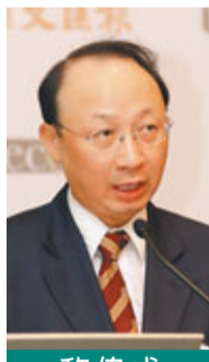
黎偉成 資深財經評論員