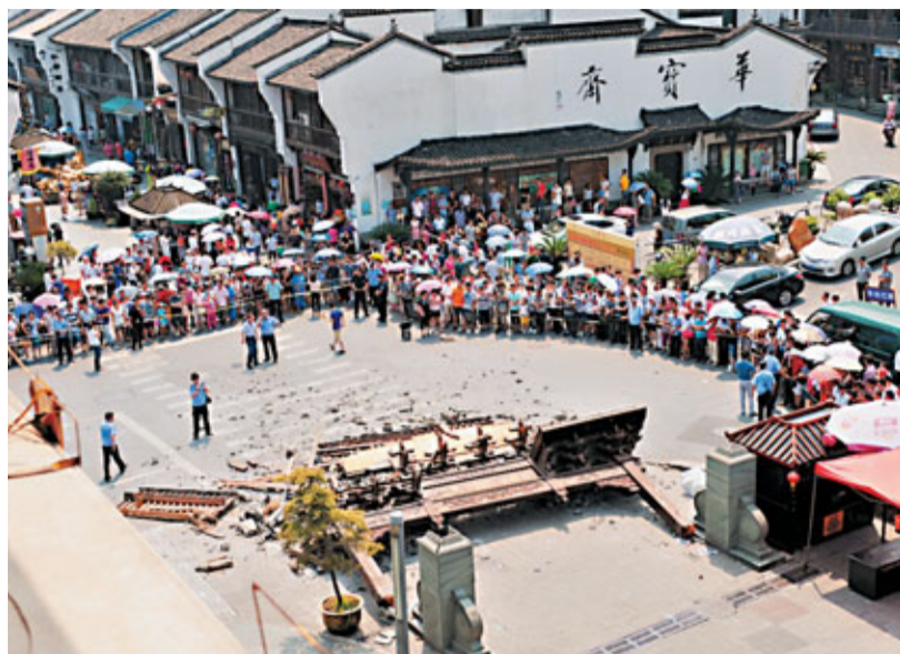
杭州鬧市區12日發生一宗牌坊倒塌事件,造成兩人遇難一人重傷。圖為事發現場。