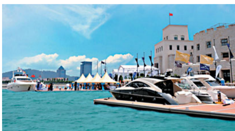
南沙遊艇會計劃完成二期擴建迎接國際遊艇博覽會。

香港文匯報訊(記者 古寧、蘭紅柳 廣州報導)廣州南沙區有關部門日前透露,廣州首個國際遊艇博覽會將於10月12日至14日在南沙灣的廣州南沙遊艇會舉行,屆時全球各大著名的遊艇參展商將雲集南沙。主辦方稱,將致力打造南中國水上展區規模最大、參展外商及觀眾最多並領先內地的船艇及相關設備與服務、優質高尚生活文化盛會,致力打造中國最具規模的遊艇行業B2B、B2C交易平台,並輻射內