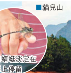
■蜻蜓淡定在手上停留