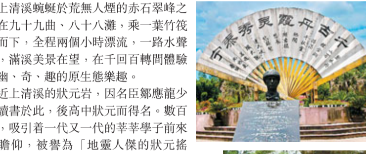
■地質公園的名人大道