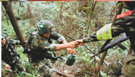
■警方在歌樂山附近山脈搜索。

同時，警方還特別提醒稱，因該案犯窮兇極惡，市民若發現其行蹤，不要驚動或自行抓捕，迅速報告公安機關，避免意外傷亡。