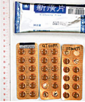
■中成藥新廣片疑含西藥成分。

她其後被轉送瑪麗醫院接受進一步治療。她表示入院前因喉痛曾服用過上述中成藥及其他西