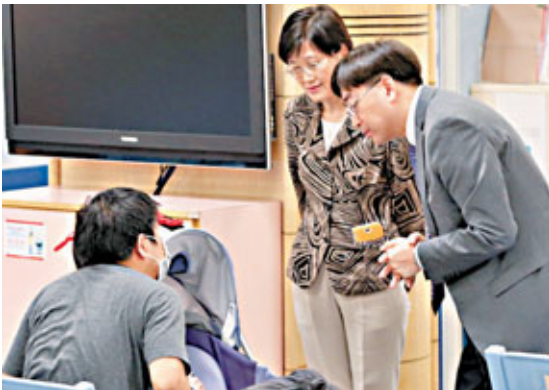
■高永文（右）昨晚視察西灣河母嬰健康院，嬰兒驗血情況。

市民可致電衛生署設立的熱線電話2125 1111查詢，有關事件的最新資料，將上載於衛生署網頁www.dh.gov.hk。