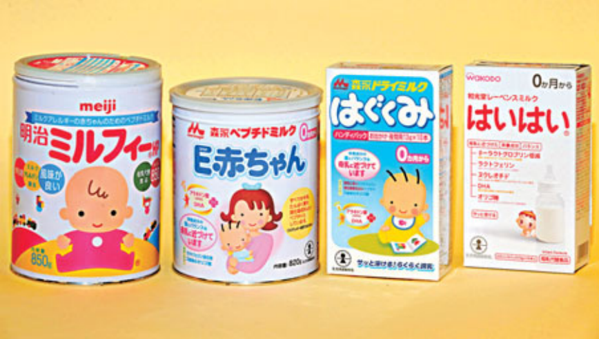
■新驗出四款日本嬰兒配方奶粉碘含量較低。

食物及衛生局局長高永文表示，政府會繼續對其他配方奶粉做檢測，一有結果就會立即公布，又表示，政府正準備盡快訂立嬰兒配方奶粉的營養素含量及營養標籤的規管方案，並為有關的立法工作着手準備。