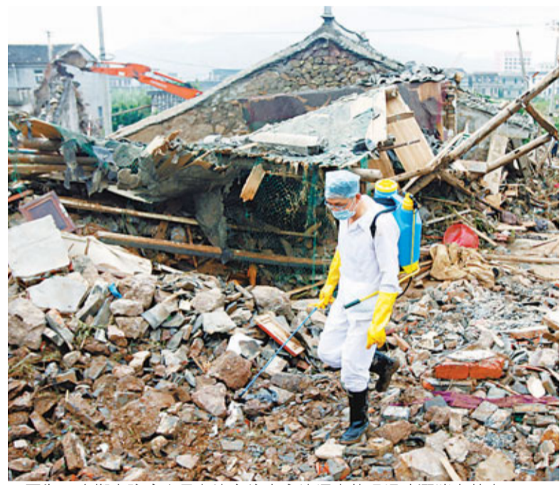
圖為一名衛生防疫人員在沈家坑水庫垮塌事故現場噴灑消毒藥水。

香港文匯報訊(記者 潘恆 浙江報導) 因強颱風「海葵」過境,浙江岱山縣長涂鎮沈家坑水庫昨日凌晨4時許發生潰壩事故,截至當日中午12點,已確認事故死亡人數10人,傷27人,受災戶數80戶,房屋倒塌210多間。另外,湖洲市的太湖蟹養殖基地也因此次颱風蒙受了巨大損失。