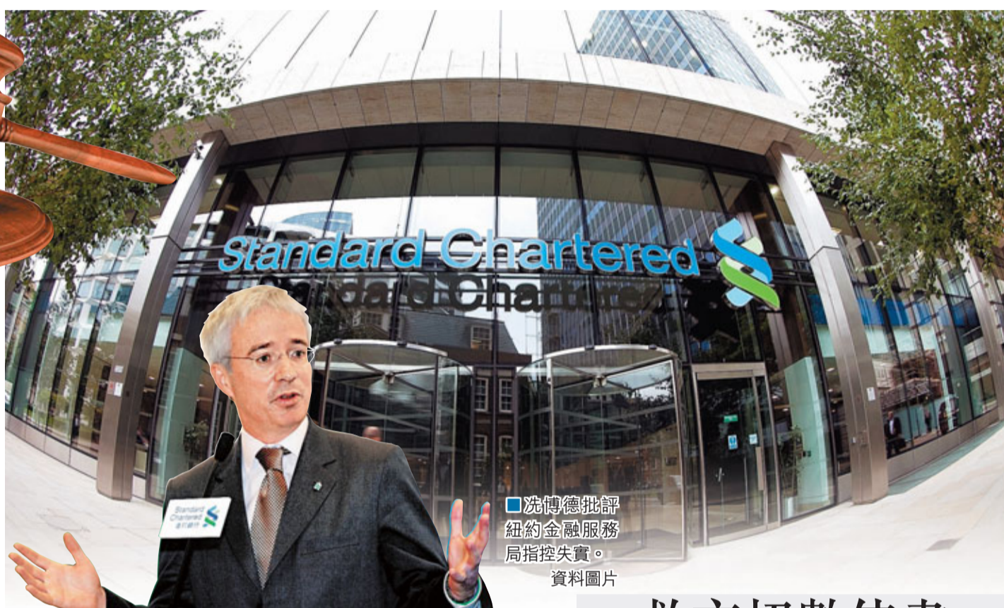
洗博德批評紐約金融服務局指控失實。