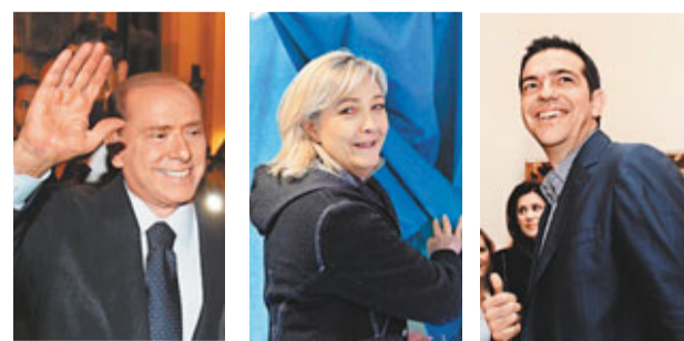
貝盧斯科尼 勒龐 齊普拉斯

德國《明鏡》周刊發表評論文章，列舉深化歐債危機的政客，並批評他們都是民粹型的政治領袖，指他們慣常訴諸於廉價的民粹，以抬高個人政治聲望，而且過度簡化當前複雜棘手的情況，以致危機深化。