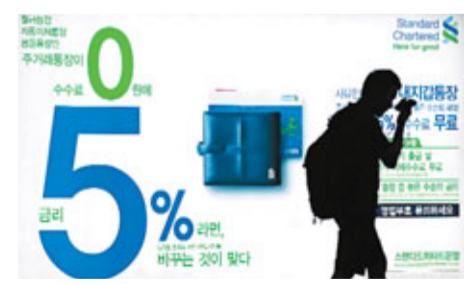
渣打位於首爾的分行。

韓國金融監督院(FSS)昨日表示，鑑於匯豐控股及渣打集團有海外分行涉嫌洗黑錢，當局將查核該兩行韓國分行的交易，確保銀行合法營運。