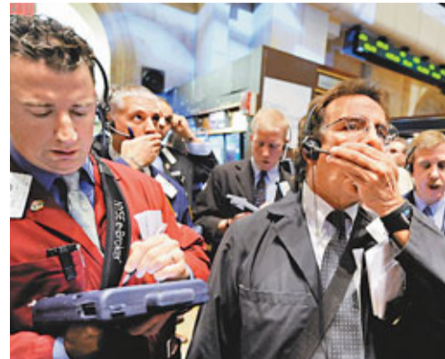
金融危機期間，不時可見紐約交易員面露驚恐之色。

2007年8月9日，英國北石銀行因次按損失陷入財困，當天道瓊斯工業平均指數大跌387點，後來歐洲央行向銀行業注資950億歐元(約9,096億港元)救亡，為金融危機揭開序幕。北石前行政總裁阿普爾加思形容當天「世界改變了」，5年後的今天，全球經濟已經歷一番洗牌，金融機構遭淘汰、政府收緊監管條例，不變的是，市場信心仍未恢復。