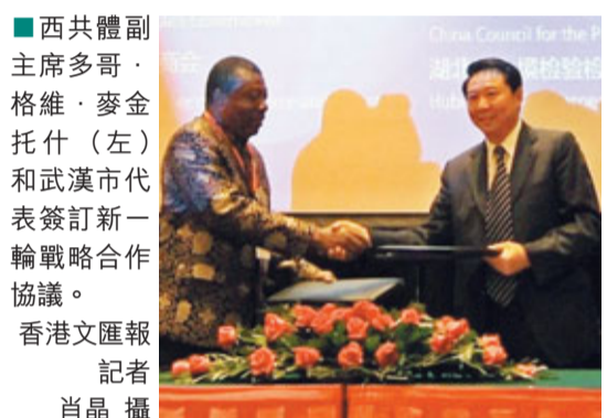
西共體副主席多哥、格維·麥金托什(左)和武漢市代表簽訂新一輪戰略合作協議。

式,會上他回顧了2009年至2011年間西共體地區和湖北當地企業的多次交流互動,其中2010年赴非湖北企業家達80人,2011年這個數字增長到130人,而2012年將有150人。