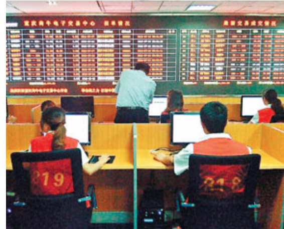
重慶豐都肉牛電子交易開內地先河。

香港文匯報訊(記者 楊毅 重慶報道)內地肉牛產業格局被重慶豐都改變。日前,中國西南地區最大肉牛及其產品交易市場——中國南方(恒都)肉牛綜合交易市場和內地首個肉牛電子交易中心,同時在重慶豐都縣開市交易,實現了內地肉牛網絡電子交易「零」的突破。