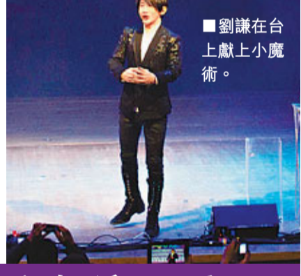
劉謙在台上獻上小魔術。