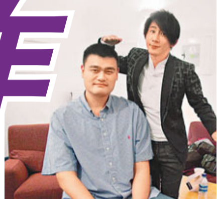
劉謙調侃姚明坐着終於比自己矮出一截。