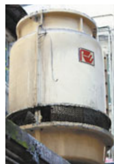
機電工程署發現6個淡水冷卻塔水樣本退伍軍人病菌數量超標。資料圖片

退伍軍人病菌是由退伍軍人桿菌引起的傳染病,本港1994年3月起已把退伍軍人病菌列為法定須呈報傳染病。退伍軍人病菌可在多種環境存在,尤其適合在20℃至45℃溫水生長,如水缸、冷熱水系統、冷卻水塔、按摩池等。患者有機會因吸入受污染水點和霧氣染病,但該病不會透過人與人接觸或飲食傳播。