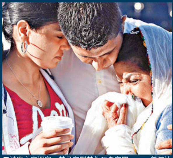
■神廟主席遇害，其子安慰其他死者家屬。