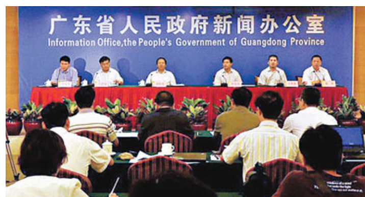
廣東省7日公佈新出台的《廣東省河道採砂管理條例》。

香港文匯報訊（記者 顧一丹 廣州報道）廣東省7日公佈新出台的《廣東省河道採砂管理條例》，新條例將加大對無證採砂等違法行為的處罰力度，最高罰款從原來的30萬提高至100萬。而對造成水工程損壞、河勢改變、水生態環境破壞等等行為則可能追究刑事責任。