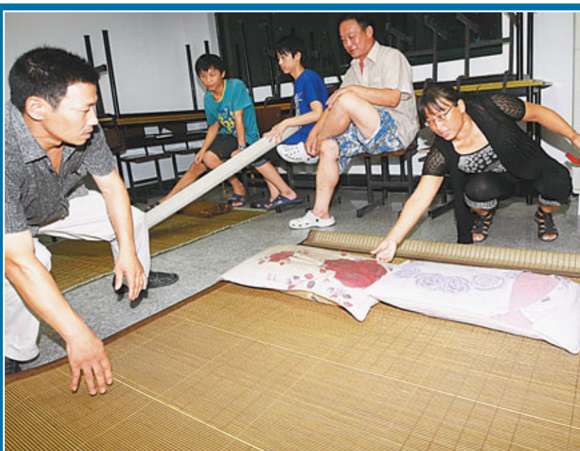
圖為上海市金山區的部分轉移群眾在臨時安置點佈置鋪位。