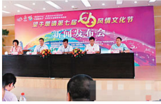
東莞市系列文化活動之望牛墩鎮第七屆七夕風情文化節將於22日開幕。

香港文匯報訊（記者 余麗齡 東莞報道）東莞市系列文化活動之望牛墩鎮第七屆七夕風情文化節將於22日至24日舉行。文化節將以「嶺南水鄉·幸福樞紐」為主題，通過舉辦開幕晚會、七夕T恤設計徵集、原創愛情短信徵集、情歌大賽、水鄉特色美食街、鵲橋相會晚會、民間祈福儀式、閉幕晚會等項目，集中展示該鎮的水鄉生態、人文資源和文化魅力。 經過七年六次的打造，望牛墩七夕文化品牌已在全省乃至全國有了一定的知名度，望牛墩也因此獲得了「中國乞巧文化之鄉」的美譽。同時，該鎮先後建成了七夕文化牆、七夕文化長廊、七夕文化公園、鵲橋等一批七夕文化陣地。