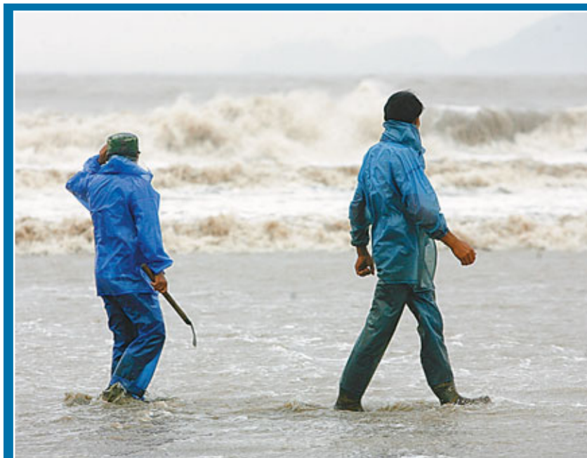
圖為颱風來襲前，兩名巡視員在浙江省象山縣石浦鎮的海邊巡視。