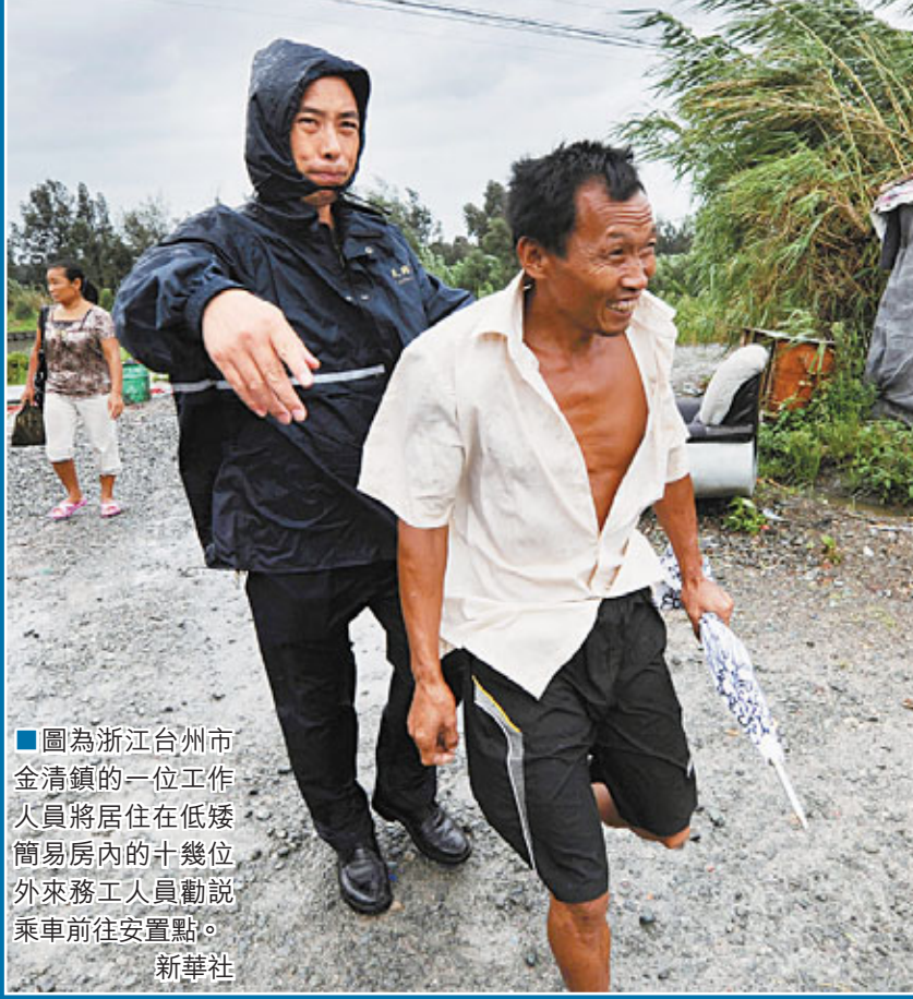
圖為浙江台州市金清鎮的一位工作人員將居住在低矮簡易房內的十幾位外來務工人員勸說乘車前往安置點。

氣象台特別提醒，強颱風「海葵」的對流雲帶較為密集，強對流天氣活躍。市民應加強自我防範意識，面對災害風險要善於規避，盡量減少戶外活動，確保生命安全。