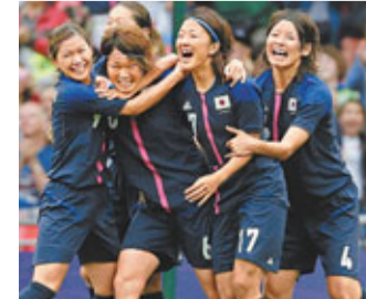
■日本球員雀躍萬分。

日本女子足球隊本港時間8日凌晨在奧運女足準決賽戲劇性地以2:1擊敗強敵法國，力圖成為史上第2支包辦世界盃與奧運雙料冠軍的隊伍。而美國在奧脫福球場，加時最後1分鐘險勝加拿大4:3，將在決賽洗刷世界盃敗給日本的恥辱，放眼奧運3連霸。