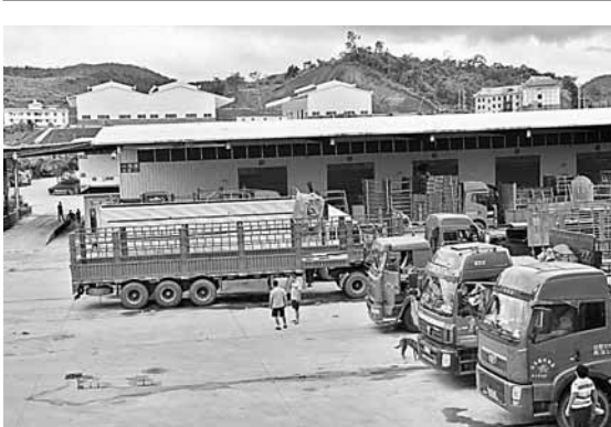
■投資9500萬元建設的磨憨口岸國際物流中心一期項目已經投入使用