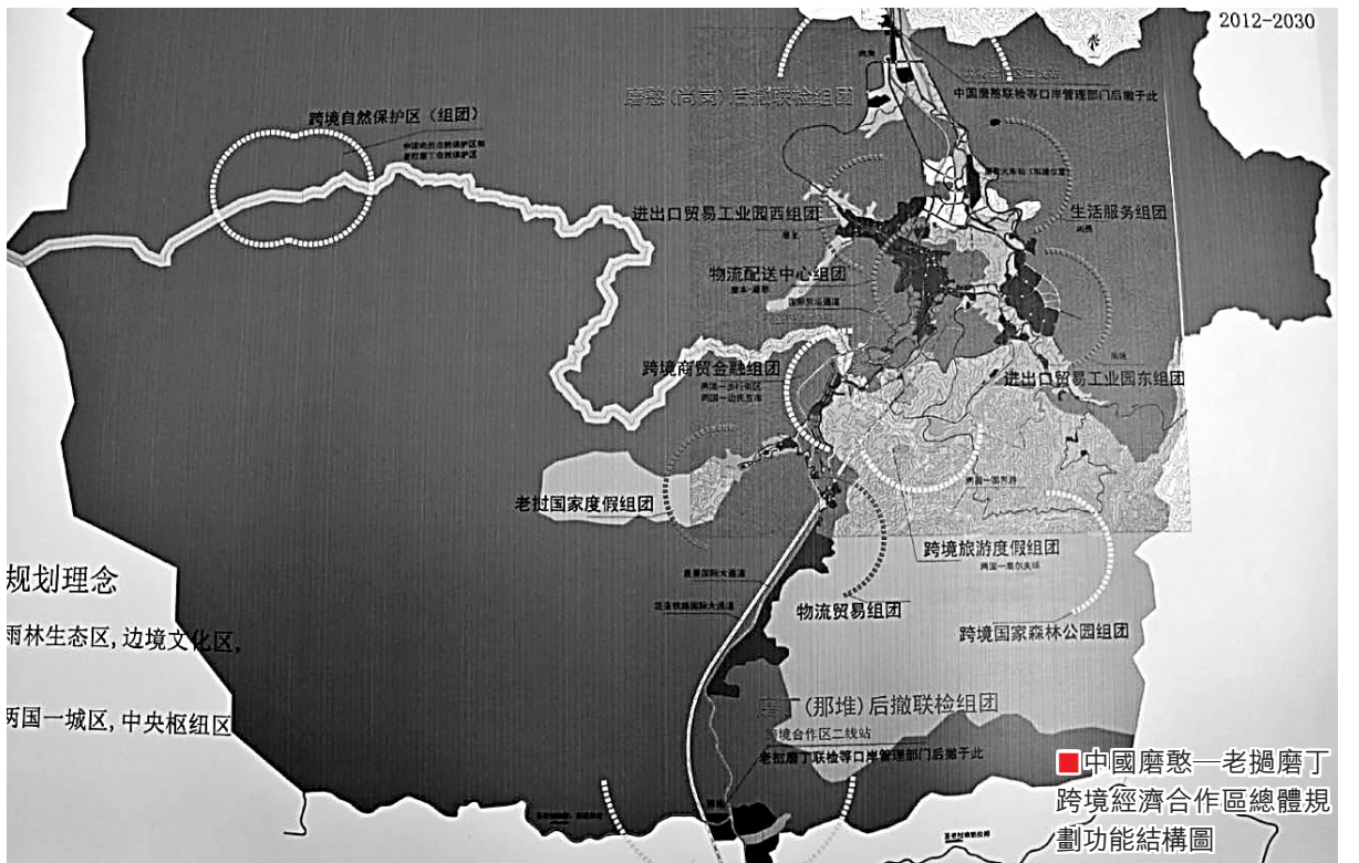
■中國磨憨—老撾磨丁跨境經濟合作區總體規劃功能結構圖