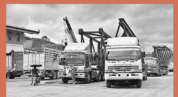
■大為商貿公司的貨場裡，許多掛着老撾牌照的貨車正在等待拉貨。

近年來，隨着雲南「橋頭堡」戰略的實施，雲南參與GMS合作日趨深入，磨憨、景洪港等節點在周邊形成了商貿熱點區，越來越多的各國民眾投身於其中創業創富。專家指出，在建設GMS南北經濟走廊過程中，各國各方應力爭在資源、人力、技術、資金、設施等方面優勢互補，共同對抗金融危機後期的影響，實現發展共贏，最終實現走廊沿線民眾的共同富裕。