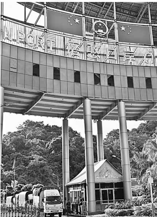
■在磨憨口岸排隊等待通關的貨車