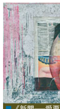
《新聞——愛要當面表達》