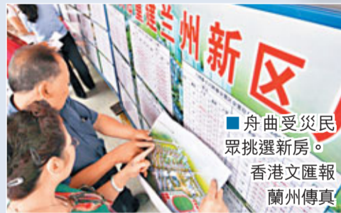
舟曲受災民眾挑選新房。香港文匯報蘭州傳真

工驗收工作。高輝明表示，為了使舟曲的衛生工作早日步入正軌，方便舟曲城鄉居民就醫，甘肅省衛生廳正在抓緊組織相關設備的進場和安裝調試，保證新建辦公樓能按時投入使用。