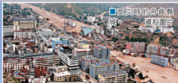
受災時的舟曲縣城。資料圖片

災後兩周年祭日。曾經是滿目瘡痍之地，轉眼兩年過去，重建項目已完成近半，災戶開始選房，各種新建設施如醫院、學校、文娛中心即將啟用，災區民眾亦逐漸走出陰霾。本報將連續兩日介紹舟曲災後重建情況，其地方政府如何透過一系列措施防範自然災害，亦闡述舟曲開發扶貧概況。