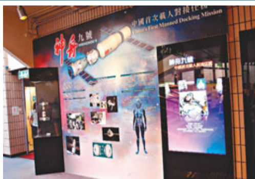
香港太空館的大堂有關於「神九」的展覽展出。