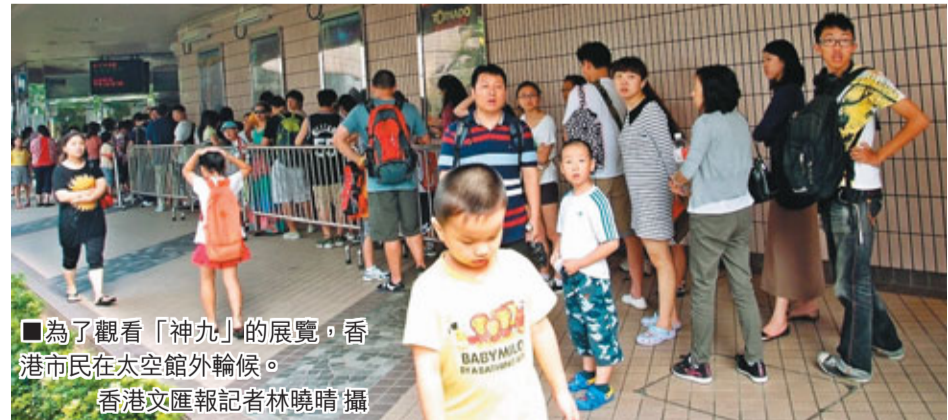
為了觀看「神九」的展覽，香港市民在太空館外等候。