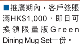
推廣期內,客戶簽賬滿HK$1,000,即可換領限量版Green Dining Mug Set一份。

UG層的DBS信用卡推廣專櫃設「Green Dining綠色飲食新概念」展覽,由本地插畫家Telephone Fung創作一系列線條簡單兼趣味的卡通人物帶出「綠色飲食」新概念,示範如何將綠色飲食輕鬆帶到日常生活當中,並提醒大家不要浪費及實踐零污染,要吃得健康之餘,又不可破壞自然生態。由即日起至2012年9月16日推廣期內之五、六及日,DBS客戶更可憑DBS白金卡或DBS Titanium Card在又一城商場累積淨簽賬滿HK$1,000,即可換領限量版精美Green Dining Mug Set一套,讓大家時刻掌握綠色智慧。