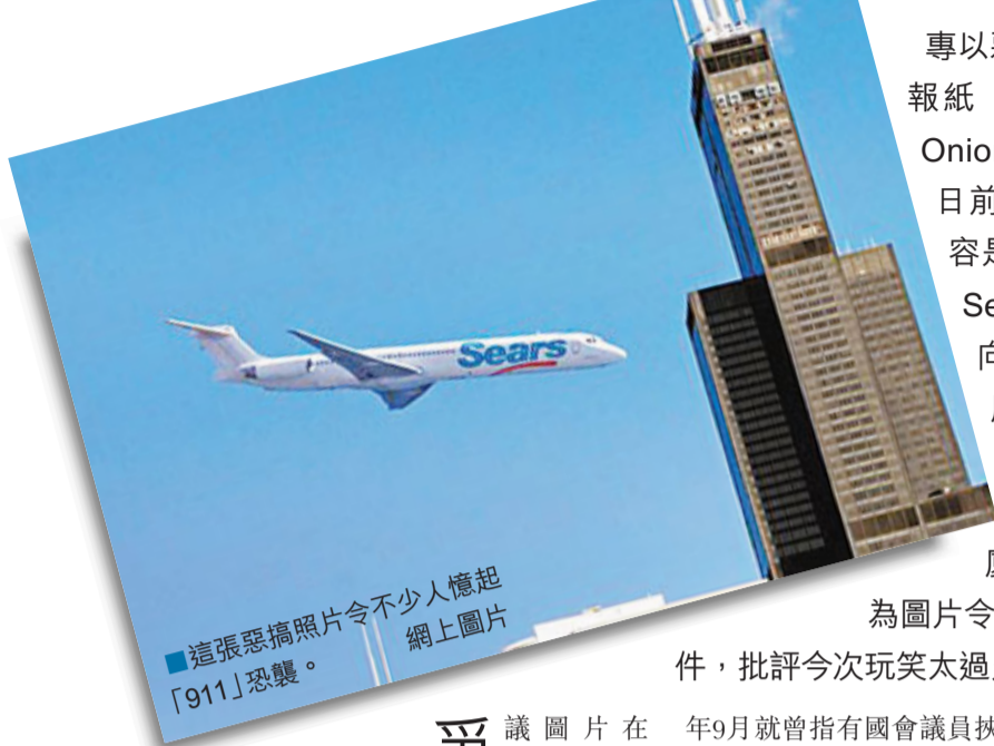
這張惡搞照片令不少人憶起「911」恐襲。

專以惡搞諷刺時弊的美國報紙《洋蔥新聞》(The Onion)再惹爭議!該報日前刊登一張圖片,內容是一架印有零售巨擘Sears商標的飛機,撞向芝加哥威利斯大廈,圖片說明稱「Sears激進分子駕駛飛機衝向威利斯大廈」。有紐約讀者認為圖片令人回想起「911」事件,批評今次玩笑太過火。