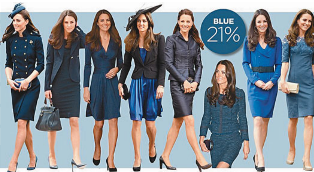
英國王妃凱特上週榮膺美國時尚雜誌《名利場》年度最佳衣着名人,《星期日郵報》分析其衣着習慣,發現她原來最愛王室藍色,幾乎有21%時間都以這種衣色示人。【星期日郵報】