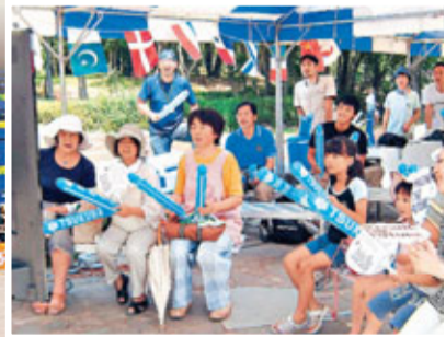
■福島居民觀看日本單車隊作賽。