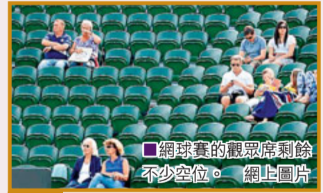
■網球賽的觀眾席剩餘不少空位。