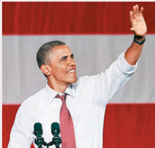
■奧巴馬(左)祝賀菲比斯(右)奪金。