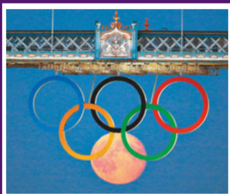
■此刻月亮與奧運五環「相扣」，形成六環奇景。

路透社攝影師麥格雷戈上周五拍攝到一張令人嘆為觀止的照片，懸掛在倫敦塔橋上的奧運五環，剛好與滿月合為一體，形成「奧運六環」，麥格雷戈把握時機按下快門，留下明月美景。照片結果在網上瘋傳，「倫敦塔橋」更成為微博twitter熱門話題。