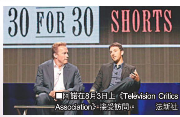
阿諾在8月3日上《Television Critics Association》接受訪問。

談的合作的過程。阿諾說道在過去他們都沒有機會合作，就算有段時間雙方都有時間，但可惜沒有適合的劇本，或是製作公司對合作沒有興趣。阿諾與史泰龍的合作實屬偶然。他透露有一天他在髮型屋剪髮剛碰見史泰龍，史泰龍直呼「oh man」打招呼，並主動上前邀約阿諾合作他的電影《轟天猛將》；當年阿諾還是加州州長並暫時放下電影工作。但當時阿諾即時答應合作並在百忙之中利用周末時間為《轟天猛將》進行拍攝。最終電影在2010年完成。由於阿諾在《轟天猛將》的客串演出深受歡迎，史泰龍再次接觸阿諾，促成這次二度合作。《轟天猛將2》將會在8月17日於美國上映。各影迷又再次有機會見兩大猛男大騷肌肉。