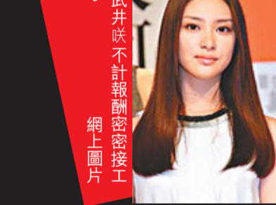
武井咲不計報酬秘密接工作。