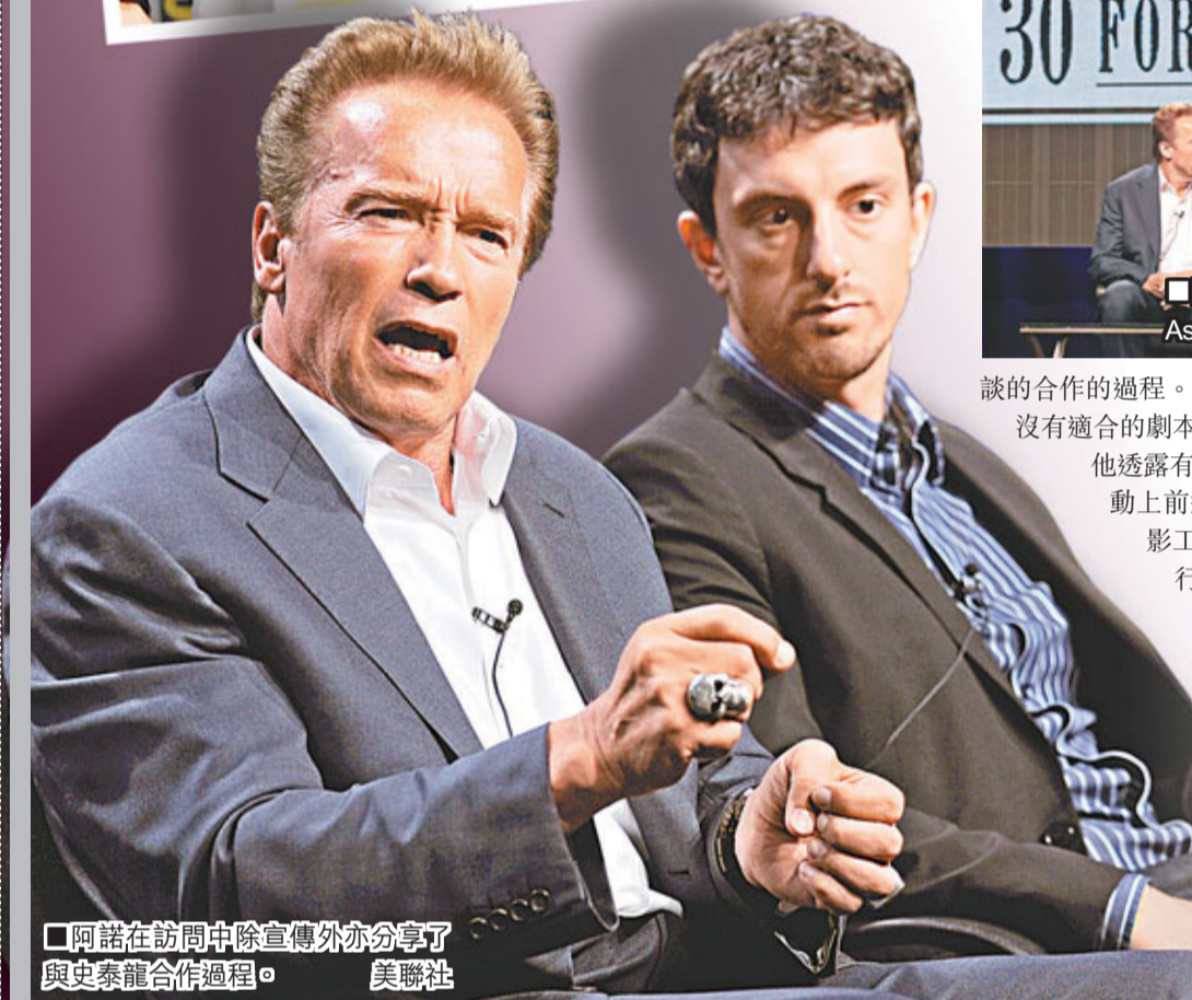
阿諾在訪問中除宣傳外亦分享了與史泰龍合作過程。