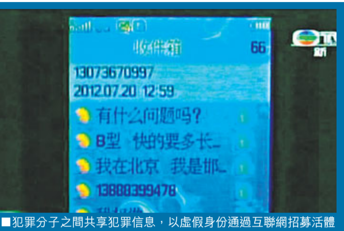
■犯罪分子之間共享犯罪信息，以虛假身份通過互聯網招募活體器官提供者。

近年來，中國人體器官移植的供需矛盾突出，受暴利驅使，少數不法分子乘機組織出賣人體器官，並形成犯罪網絡，嚴重侵害了器官提供者的健康權益，加重了需要移植器官患者的經濟負擔，破壞了正常的醫療和社會管理秩序。