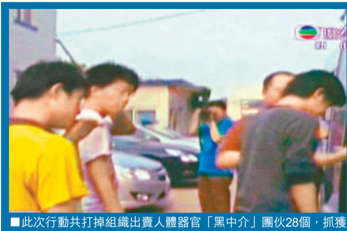
■此次行動共打掉組織出賣人體器官「黑中介」團伙28個，抓獲犯罪嫌疑犯137名。

香港文匯報訊 據中新網4日報道，日前，內地18個省市公安機關開展集中行動，嚴厲打擊組織出賣人體器官犯罪。共打掉組織出賣人體器官「黑中介」團伙28個，抓獲犯罪嫌疑犯137名，有力地遏制了此類犯罪的發展蔓延。