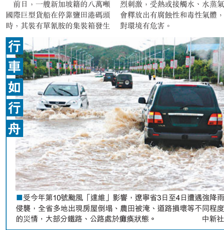
■受今年第10號颱風「達維」影響，遼寧省3日至4日遭遇強降雨侵襲，全省多地出現房屋倒塌、農田被淹、道路損壞等不同程度的災情，大部分鐵路、公路處於癱瘓狀態。

據介紹，單氫胺為無色(或微黃)透明液體，主要用於農藥中間體，常溫常壓下具有穩定性，對水十分敏感，通過吸入和皮膚接觸可對呼吸道、眼睛等造成強烈刺激，受熱或接觸水、水蒸氣會釋放出有腐蝕性和毒性氣體，對環境有危害。