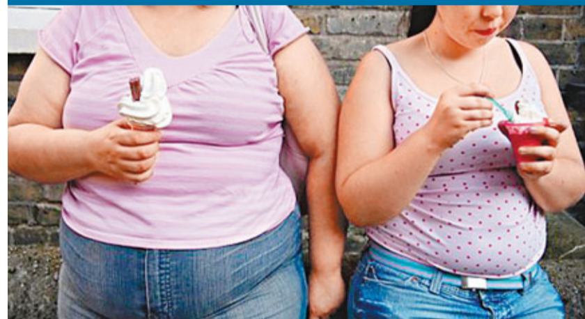
■gp78可作為治療肥胖、糖尿病等代謝疾病的靶標。科研人员沿着這條道路，有望開發出治療代謝疾病的新藥。網上圖片

香港文匯報訊 據《新聞晚報》報道，國際權威學術期刊《細胞代謝》(Cell Metabolism) 前日發表了中科院上海生命科學研究所與細胞生物學研究所的最新研究成果，宋保亮與李伯良研究組發現了一個名為「gp78」的「肥胖相關基因」。這一發