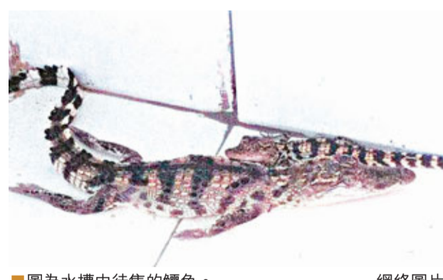
圖為水槽中待售的鱷魚。