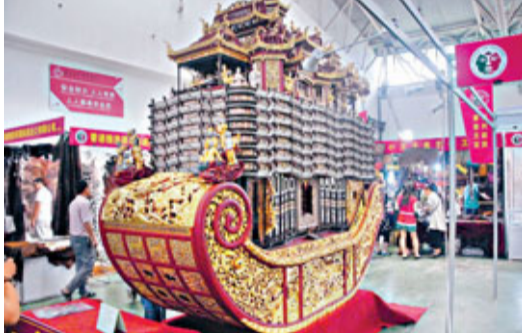
寧波最大「船鼓」在第七屆中國民間藝術博覽會4號展館亮相。

「船鼓」雖然多達九層，卻繁而不亂、結構嚴謹、華貴多姿，令人叫絕。第一層是當地民眾的生活場景，如春耕、雨歸、鋤禾、鬧龍舟等。第