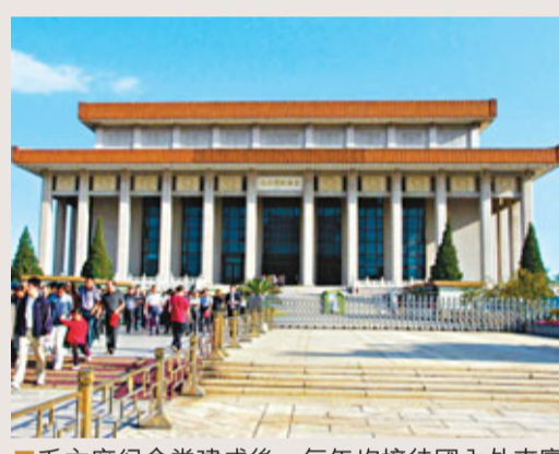
毛主席紀念堂建成後，每年均接待國內外來賓和廣大人民群眾瞻仰毛主席遺容。