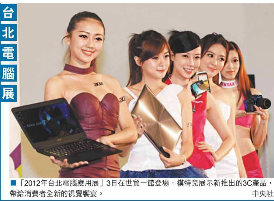
「2012年台北電腦應用展」3日在世貿一館登場，模特兒展示新推出的3C產品，帶給消費者全新的視覺饗宴。

新北市去年爆發營養午餐弊案，多名涉案校長遭約談，甚至收押，造成新北市30多位校長停職，嚴重衝擊教育界。今年8月新卸任校長共有82名新任校長，是去年22人的3倍多，超過全新北市中小學的1/3，新北市教育局副局長龔雅雯證實，「人數及比例都創新高」。