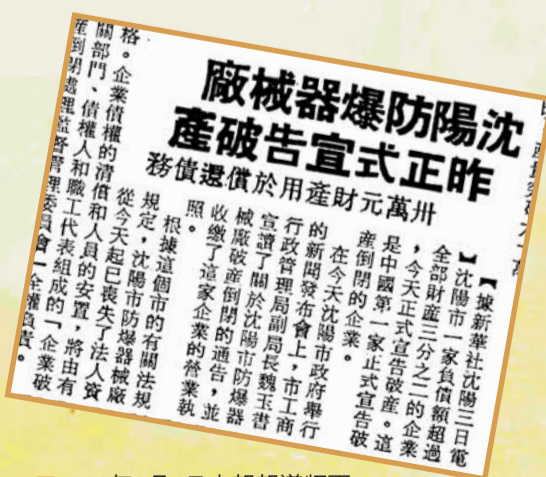
1986年8月4日本報報道版面。

1986年9月25日，瀋陽市防務器械廠被整體拍賣。瀋陽市煤氣供應公司出價20萬元，買下這家破產企業的全部廠房、設備、製成品。此次拍賣所得的20萬元按比例償還給債權人。