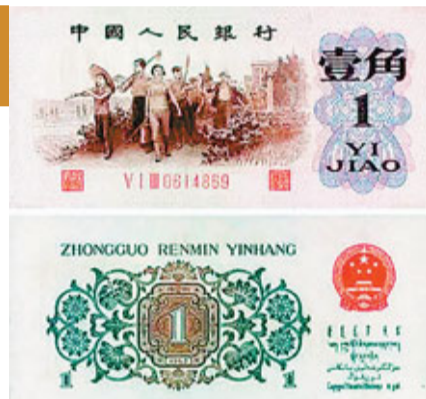
第三套人民幣壹角紙幣身價竟漲近50萬倍，足以買輛小汽車。