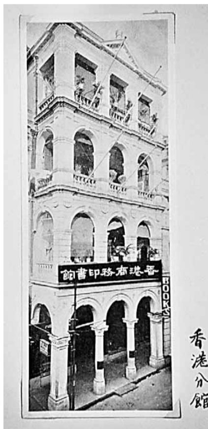
■商務印書館香港分館於1914年成立

此外，商務還利用自身豐富的語文出版資源，推出了中文學習平台「階梯閱讀空間」，因應學生個別語文水平，提供不同程度的文章及練習題，既能照顧學生學習差異，亦讓孩子在課外閱讀中打穩中文基礎。這一平台如今已經吸引不少本地及國際學校應用。