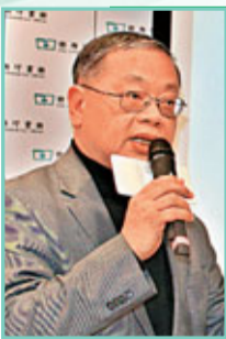
李焯芬教授 香港大學專業進修學院院長

商務印書館1897年在上海創立，十七年後在香港成立分館。這家「百年老店」本著「倡明教育」的精神，百年來的業績本身就是一部現代中國文化傳播與出版業的演進史。百年老店，承先啟後，繼往開來，合該如是。