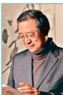
鄭培凱教授 香港城市大學中國文化中心主任

「商務」是香港人的精神家園。少時，在港島聖約瑟書院唸書，下課後最愛到大道中的「商務」打書釘。「商務」為我的成長提供了極為豐厚、不可或缺的精神養分。九十年代初回港工作後，我和「商務」在銅鑼灣再續前緣。為了去「商務」看書，經常找藉口去銅鑼灣。「商務」永遠是香港人的精神家園。