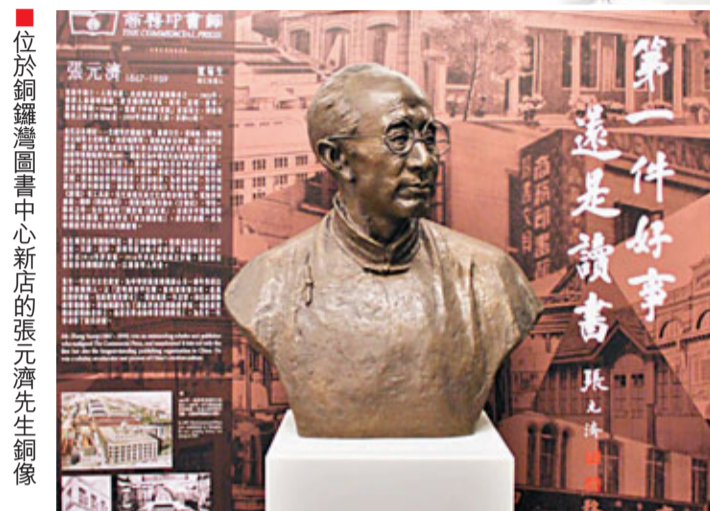
位於銅鑼灣圖書中心新店的張元濟先生銅像