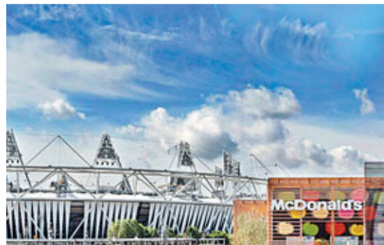
麥當勞在奧運公園附近興建一幢可容納逾千人的新餐廳。

商，結果虧大本。在「TOP贊助商計劃」下，贊助商的數目是貴精不貴多。經過投標出價後，倫敦奧運的國際贊助商僅十一家，包括：麥當勞、Visa、陶氏化工等。國內贊助商有四十四家，如：英航和英國石油。他們共贊助十三億英鎊，佔去今次奧運總開銷(二十億英鎊)逾一半。