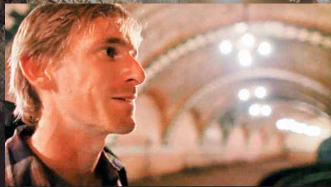
美國冒險家史蒂夫·鄧肯。