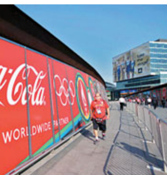
可口可樂是倫敦奧運會十一家國際贊助商的其中一家。