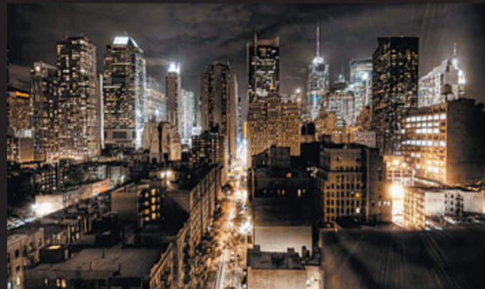
紐約市晚上燈火通明，此時城市探險家正拿着燈，悄悄走進地下世界。