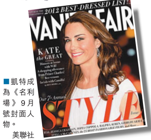
凱特成為《名利場》9月號封面人物。