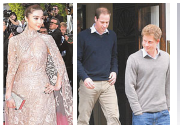
范冰冰(左)及威廉(右)及哈里

男性方面，威廉王子雖跌出榜外，但弟弟哈里則首次上榜就奪冠，顯示王室魅力沒法擋。凱特與哈里並非唯一上榜王室成員，卡塔爾王妃莫扎、丹麥王儲妃瑪麗亦穩佔一席，為Gucci擔任模特的摩納哥夏洛特公主亦首次上榜。