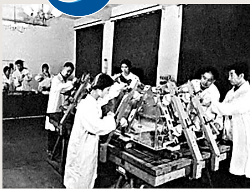
■當年的技術人員在組裝存放毛主席遺體的水晶棺。

揭秘毛主席水晶棺製作內幕 6月9日，上海市檔案館開放第24批檔案，這批開放檔案資料「講述」了「文革」後上海一個重要的歷史事件——1977年上海新滬玻璃廠(以下簡稱「新滬廠」)等單位承擔毛主席紀念堂水晶棺的石英玻璃研製生產任務。