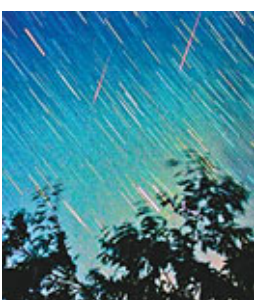
■英仙座流星雨的極大期很可能出現在8月12日的幾天裡，流量都比較可觀。根據國際流星組織的預報，英仙座流星雨的極大很可能出現在北京時間8月12日20時至22時30分，預計每小時的輻射點天頂流量可達100以上。網上圖片

1日，中國科學院紫金山天文台公佈8月天宇「劇場劇目」：英仙座流星雨、月掩金星、金星西大距、水星西大距、火星合土星、海王星沖日等6個重要天象將齊現。其中，英仙座流星雨可以讓人們在一小時內欣賞到幾十顆美麗的黃綠色流星。