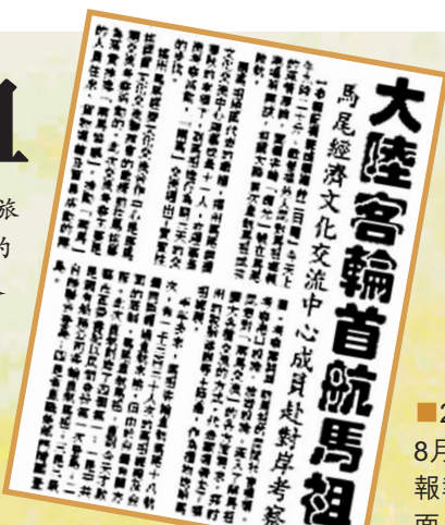
■2011年8月3日本報報道版面。

據了解，半年多來，馬祖客輪已直航馬尾18航次，有1330人次的馬祖鄉親及台灣同胞通過直航來榕。但是，由於台灣有關方面的限制，馬尾直航馬祖直到當天才啟程。