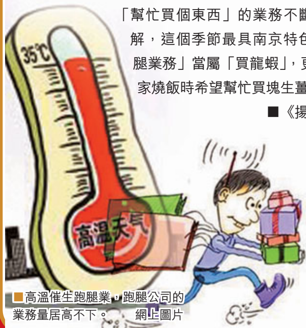
■高溫催生跑腿業，跑腿公司的業務量居高不下。

人有多「宅」，跑腿公司的生意就有多好。光是「南京跑腿110」這家公司的業務量，這個月就比春季增加了20%-30%，這一週以來，零散的日常購物跑腿需求明顯增多。