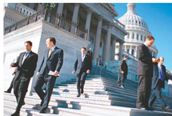
美國參眾兩院達成預算案協議。資料圖片

美國參眾兩院多數黨領袖里德前日宣佈，與眾議院議長博納及總統奧巴馬就聯邦政府預算案達成協議，聯邦政府支出將維持去年預算案的1,047億億美元(約8,12億萬港元)水平至明年3月，避免因政黨在11月前惡鬥導致政府關閉。議案雖未能趕及8月3日休會前審議，各方承諾9月復會時通過。