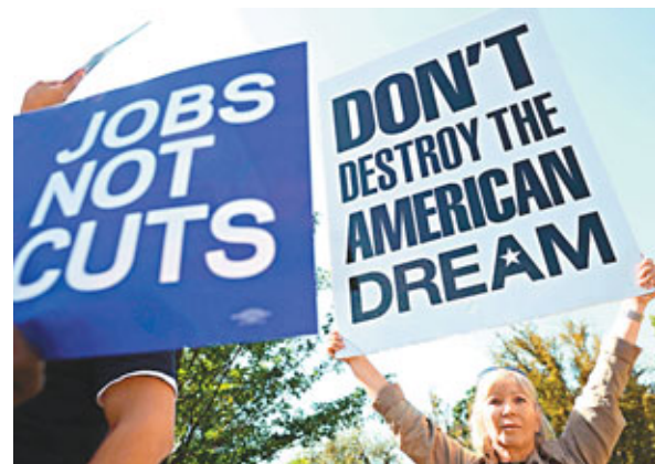
華盛頓民眾去年示威，抗議企業裁員。資料圖片

美國勞工部將於本港時間明晚公布上月就業數據，預料新增職位數目只有輕微增長，失業率仍高居不下，市場要求聯儲局出招刺激經濟的呼聲料有增無減。