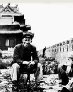
1954年毛澤東主席視察故宮時在城牆上休息。 網上圖片

毛澤東主席對紫禁城有着特殊的感情。故宮博物院院長易培基曾是他就學於湖南省立第一師範學校時的老師。1919年，毛澤東曾討驅逐湖南督軍張敬堯，就住在紫禁城腳下的福佑寺。1949年初，毛澤東曾親自指示：「此次攻城，必須做出精密計劃，力求避免破壞故宮、大學及其他著名而又重大價值的文化古跡。」正因為有了這樣一道「手諭」，才促成北平和平解放，保證了紫禁城免受戰火破壞。