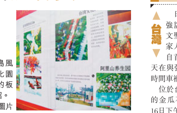
寶島風情文化園項目的板塊介紹。

據悉，該項目以「台灣民俗元素」為主題，規劃建設阿里山度假園、五緣文化廣場、日月潭遊樂園、九族風情文化園、五星級度假酒店、阿里山會展中心、宗教文化園、台灣文化街、台籍高層住宅等九個板塊，是以台灣文化、經濟、科技交流為內容，以休閒度假為形式，以民俗文化特色為主題的新型「海峽兩岸文化旅遊」產業項目和海西規模最大、檔次最高、設施最完善的台灣民俗文化風情特色項目，建成後將填補龍岩市高檔次台灣風情文化特色旅遊觀光園的空白。