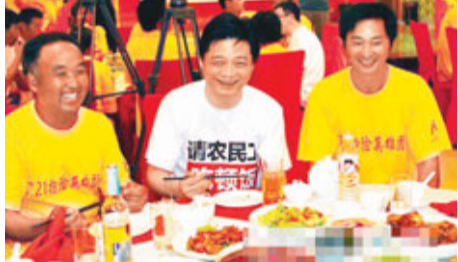
席間大家重溫了救災當天的情形。 網上圖片