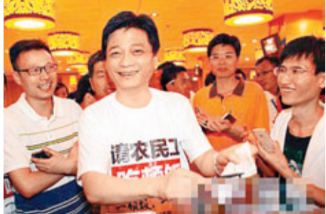
當有網友號召請這群民工吃頓飯時，崔永元第一個響應。