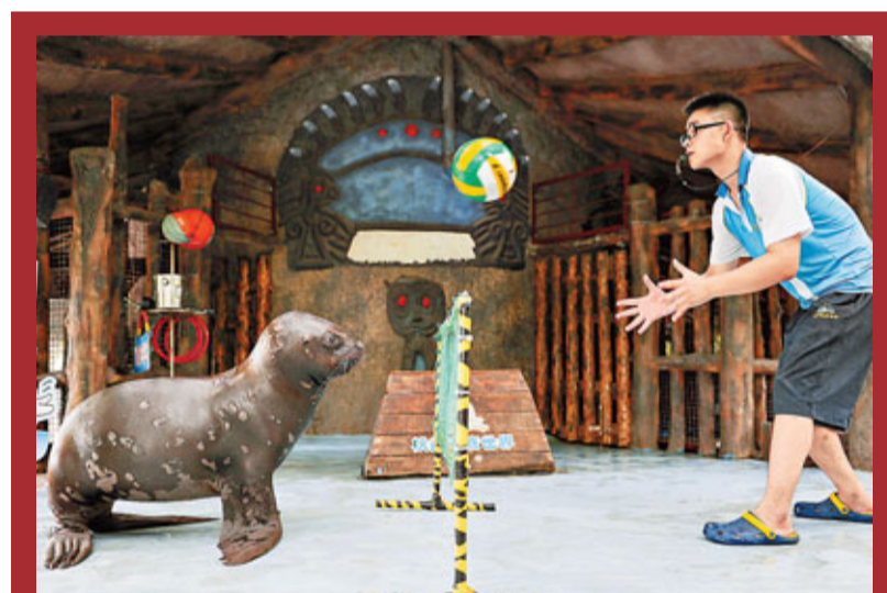
海獅也奧運。以正在舉辦的倫敦奧運會為契機，昨日杭州海底世界的海獅參加了專門為她們舉辦的海獅也奧運比賽，妙趣橫生，吸引不少遊客觀看。