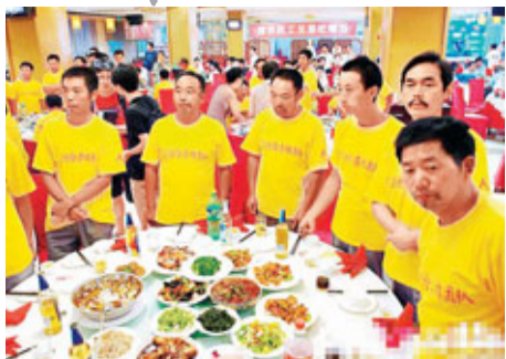
民工兄弟在這次救人行動中，他們感受到了社會的尊重。

那天發生在這154位民工身上的故事都讓崔永元等感動不已。而在外人眼中普通的一頓飯，在這些樸素的民工眼中卻意味着社會的尊重和認同。