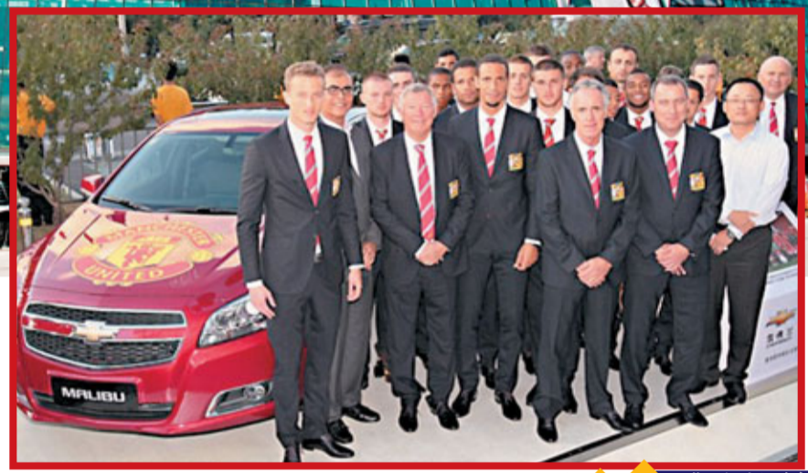
曼聯獲新贊助。曼聯官網