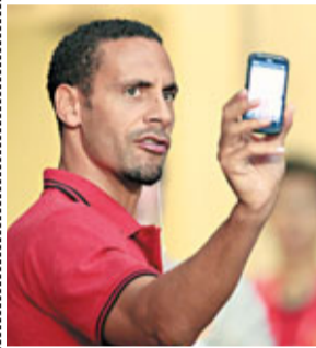
李奧季前熱身玩自拍。

另曼聯後防大將李奧費迪南遭到英足總指控,原因是他對車路士後衛艾殊利高爾(A高)進行了「不當言論的攻擊」。去年10月一場比賽,車路士隊長泰利以種族歧視用語侮辱尼士柏流浪的安東費迪南,泰利上月獲法庭判無罪。安東費迪南之後在Twitter回應網友留言「Choc ice」(指擁有白人肉色的黑人)。