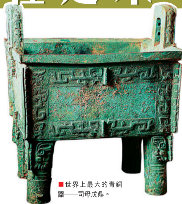
世界上最大的青銅器——司母戊鼎。

3、各界領導給予極大關注、支持和期待。 殷墟大遺址公園項目引起了各級領導、眾多專家學者、各界人士的關注和重視。國務院研究室組成專家課題組專程來安陽進行調研，形成了國務院研究室《送閱件》。中共中央政治局常委李長春親自批示，要求原國家文物局長單霽翔率隊赴安陽深入調研。原國家文物局長單霽翔調研後對殷墟提出的殷墟大遺址公園建設模式和辦法給予了高度評價，他說：「這個模式應該是大遺址公園保護的一個範本，如果搞好了，對於全國大遺址保護具有帶動和示範作用。」