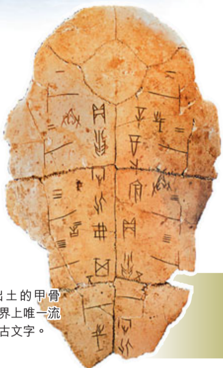
殷墟出土的甲骨文，是世界上唯一流傳至今的古文字。