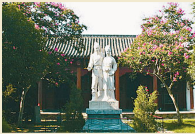
董永七仙女的傳說家喻戶曉。