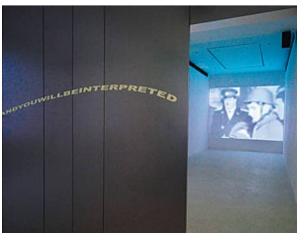
■展覽中使用一系列影片投影作品及鋁板繪畫

媒體和觀眾的觀看，在曾建華的作品中，被提出了質疑——我們該以甚麼樣的立場去觀看另一個人被處死？或者說我們又有甚麼樣的權力這樣做？罪人是十惡不赦到可以毫無生命尊嚴地被人觀看處死他的全過程嗎？近年重新看當初的新聞視