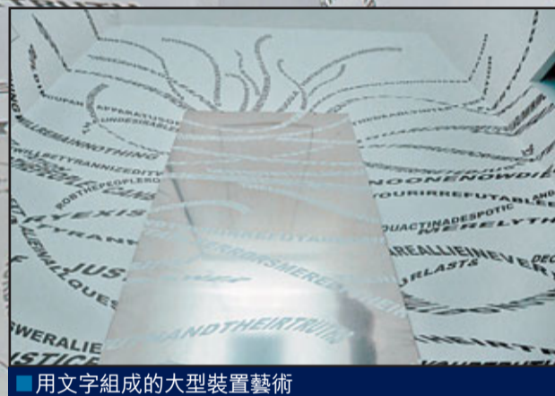
■用文字組成的大型裝置藝術

拉丁文中的「Ecce Homo」意指「看這個人！」本丟·彼拉多 (Pontius Pilate) 將耶穌釘於十字架前呈現公眾時曾說此話，而這個詞，也被作家尼采 (Nietzsche) 用作書名。曾建華引經據典以耶穌最後的審判及尼采的哲學作品，以是次展覽 Ecce Homo Trilogy I 嘗試探討審判的公正性、存在性以及在特定時間與地點之下被審判者的無能為力境況。當年通過媒體播放並記錄對獨裁者的審判及處決，令世界各地的人都不知不覺地成為判決的見證者及參與者，如同那些被彼拉多告知「看這個人！」(Ecce Homo) 時的目擊群眾。