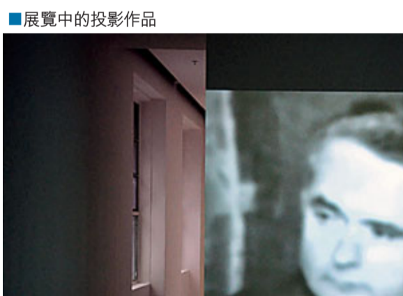
■展覽中的投影作品

頻，令他開始深入反省這些問題。於是今次他在「特定空間」中再度模擬出了監獄的空間感觀，令觀眾體會到「待罪」的特定身份之下，人會對生命有哪些重新認識。