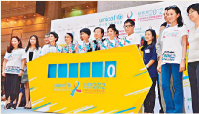
聯合國兒童基金會香港委員會委員與嘉賓為活動揭幕。

香港文匯報訊(實習記者 吳建邦) 全球每天有逾千名新生嬰兒經由母體感染愛滋病毒, 當中大部分嬰兒因得不到合適治療而活不過兩歲。聯合國兒童基金會香港委員會將於11月25日舉辦慈善跑步賽, 目標籌集900萬港元, 支援全球防治愛滋病毒母嬰傳播工作, 料可為150個發展中國家的孕婦提供愛滋病毒抗體快速測試。