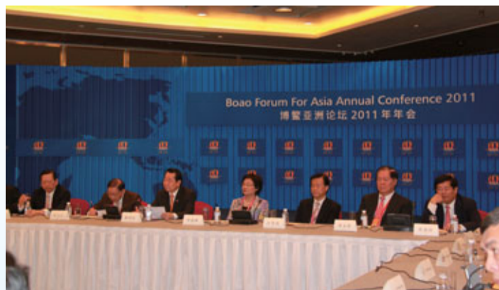
2011年4月，世茂集團董事局主席許榮茂先生出席博覽亞洲論壇首屆華商圓桌會議。