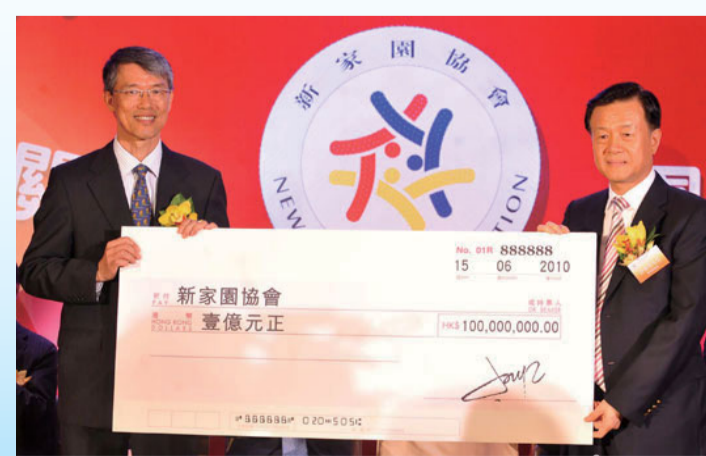
2010年6月，許榮茂先生聯合香港商界人士共同成立慈善團體「新家園協會」。

為表彰許先生對香港作出的傑出貢獻，2011年7月1日，許先生被香港特別行政區政府授予——金紫荊星章。