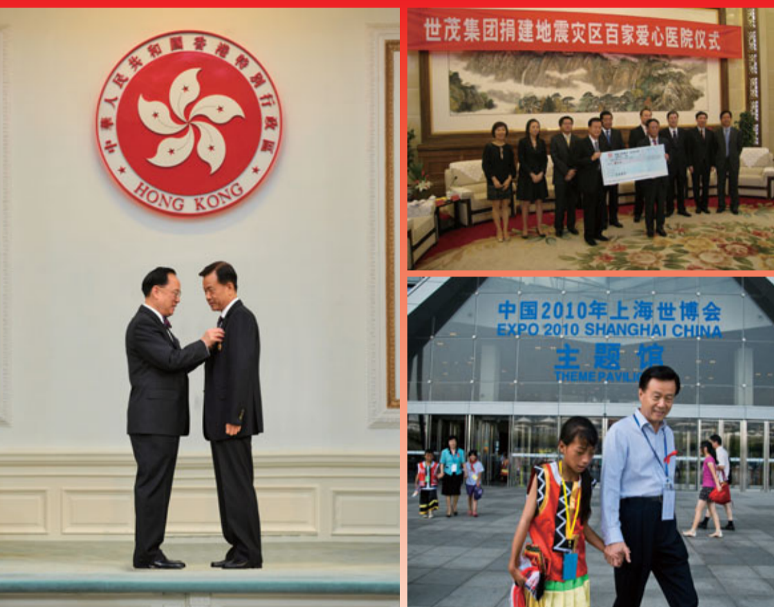
2011年7月，許榮茂先生榮獲香港特區政府頒發的「金紫荊星章」，以表彰許先生對香港作出的傑出貢獻。