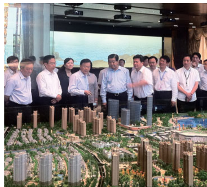
2012年6月，中共中央政治局常委、全國政協主席賈慶林到訪平潭，考察平潭海峽如意城進展情況。