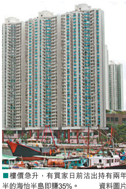
樓價急升，有買家日前沽出持有兩年半的海怡半島即賺35%。

散戶與炒輪 投資「彈藥」輸清 還有一個原因是散戶近年多炒賣輪證，但炒輪證輸多贏少，投資者輸得多，自然「沒彈藥」繼續投資，致成交進一步淡靜。他認為，在目前每日約400多億元的大市成交中，有100億元以上是輪證的成交，其餘約300億元屬高頻交易的投機盤，只炒一個半個價位的買賣，難以為市場添動力。他承認，愈來愈多人選擇離開證券業，但強調業界財務仍穩健，但投資者的信心就差過03年沙士及08年金融海嘯時期好多了。