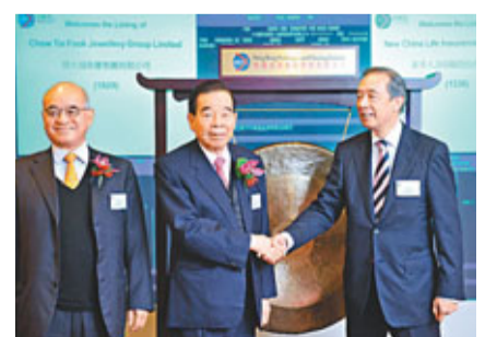
貴為去年集資王的周大福珠寶，在港交所主板掛牌上市時依然遇冷。

事實上，自從08年金融海嘯後，各大投行都逐步裁員，裁員目標更不限於低層員工，近年連中層職員也被波及，建銀國際在7月初便裁減銷售及研究部數名員工，其中兩人屬部門主管，一位負責機構銷售部，另一位是亞洲策略師。即使規模龐大如美銀美林及巴克萊亦需要「壯士斷臂」。市場消息傳出，美林繼上月底裁減部分銷售及研究部員工後，正計劃出售旗下私人銀行業務，涉及約100名職員。而巴克萊亦傳出計劃於短期內出售證券業務，以減省成本。而被指有意裁減歐洲投資銀行部三分之一高層的瑞信，近日也傳出計劃出售本港部分業務及裁員。