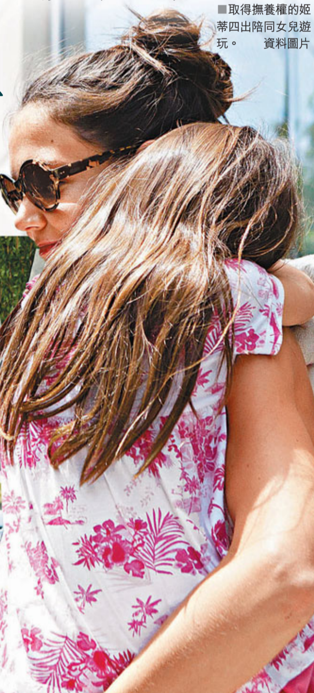
■ 取得撫養權的姬蒂四出陪同女兒遊玩。