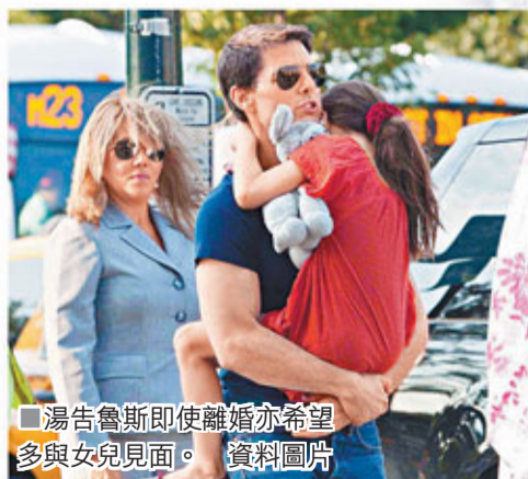
■ 湯告魯斯即使離婚亦希望多與女兒見面。資料圖片