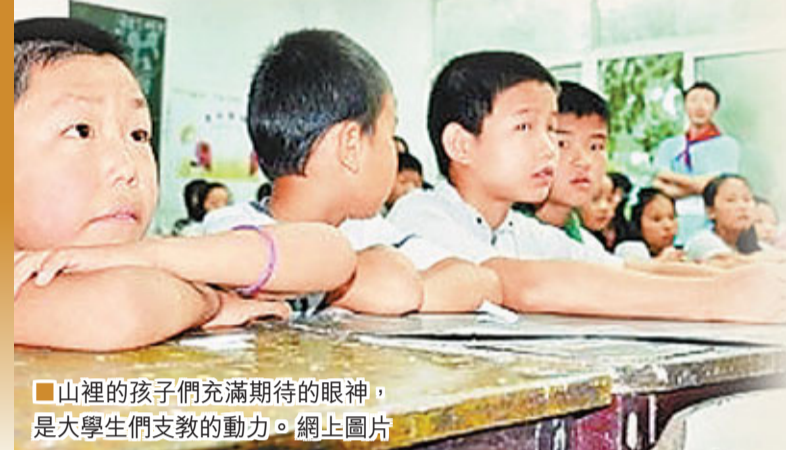
山裡的孩子們充滿期待的眼神，是大學生們支教的動力。

安徽省六安市金寨縣油坊店鄉興沖小學位於大別山北麓，學校一直沒有宿舍，很多孩子每天走幾十里山路到校上課。他們沒出過大山，沒見過大樓，不知道什麼是麥當勞、肯德基，不懂得互聯網、電腦為何物……多年前，揚州大學志願者們了解到興沖小學的情況，自發組成支教小分隊，每到假期，便到大別山深處開展支教。教孩子們知識，給孩子們講故事，跟孩子們玩耍，讓孩子們知道大山外面豐富多彩的世界。