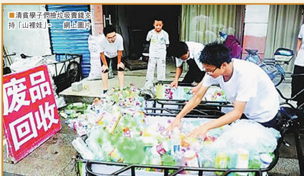
清貧學子們撿垃圾賣錢支持「山裡娃」。

暑假到來，像往年一樣，揚州大學能動學院、農學院等學院眾多青年志願者們又開始忙碌了。10年來，他們通過撿垃圾等辛苦的方式，默默進行着貧困山區的支教活動，累計為山區的孩子捐款20餘萬元。■《揚子晚報》