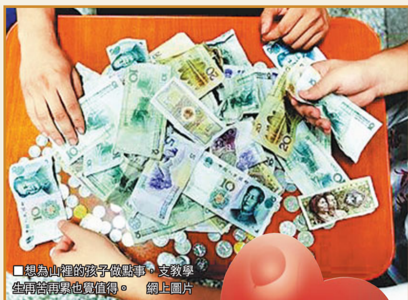
想為山裡的孩子做點事，支教學生再苦再累也值得。