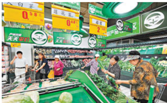
■上半年CPI寧夏最低。