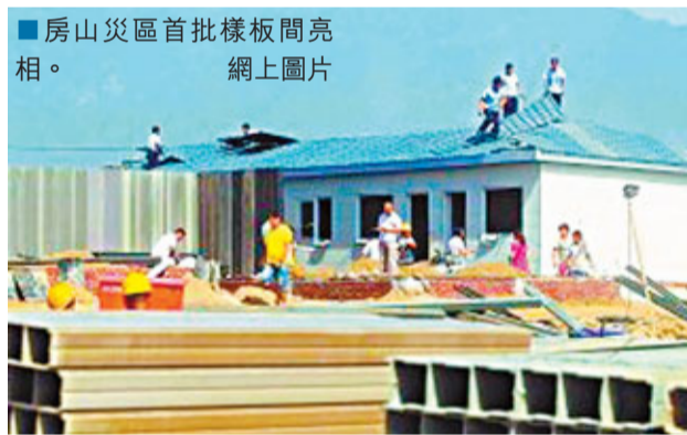
■房山災區首批樣板間亮相。網上圖片

正門和兩扇推拉窗朝南,另外兩扇推拉窗則在北面的牆上。屋內橫着可以走4大步,豎着差不多5大步可以走完,牆上已經走好了電線。建成後,每戶家庭將擁有兩間20平方米的房屋居住。配套的衛生間和洗浴間都是按照20人一個水龍頭、20人一個廁所蹲位設計的。由於房子一排一排坐落在緩坡的各個位置,因此每排房子的最前頭一間都被改造成了廚房,廚房裡面會放置灶台等廚具,保證每家人