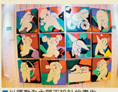
■以運動為主題而設計的畫作