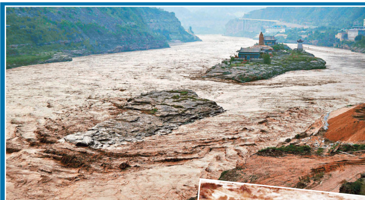
▲黃河壺口瀑布下游的孟門山景區已全部被大水包圍。

此外，新一輪強降雨還造成了陝西榆林市區以及佳縣、神木縣等縣城的嚴重內澇，街頭積水漫過行人的小腿，部分低窪的部分達到齊腰深；自來水停止供應；部分地區供電和網絡信號中斷。截至28日上午，從26日晚上開始的這次強降雨共造成陝北榆林、延安兩市6個縣區8萬多人受災。