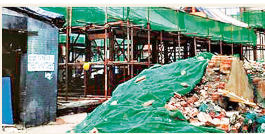
■梁思成林徽因故居正在施工，木結構房屋的骨架已經搭建起來。

至於何時開始對梁林故居的復建，這位人士表示，目前梁林故居的復建方案正在討論當中，其中也要進行專家論證，目前該方案尚未出爐。