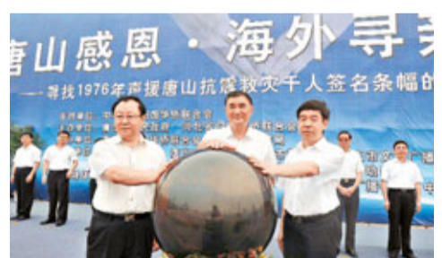
■「唐山感恩·海外尋親」活動啟動儀式現場。

法庭一審裁定張永明無視國家法律，非法剝奪被害人生命，行兇手段特別殘忍，予以故意殺人罪判處死刑，剝奪政治權利終身，判決張永明賠償被害人家屬經濟損失。