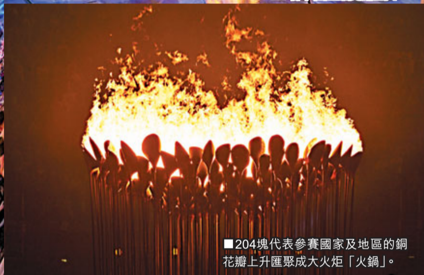
204塊代表參賽國家及地區的銅花瓣上升匯聚成大火炬「火鍋」。

2012年倫敦奧運開幕禮於香港時間昨清晨舉行，由《一百萬零一夜》英國大導演丹尼保爾操刀的大匯演，吸引全球10億人觀看。不僅《哈利波特》作者羅琳、球星碧咸及殿堂級披頭四成員保羅麥卡尼等名人紅星撐場，英女王更首度登大銀幕，與007占士邦合演一幕「跳傘」。不過最令人印象深刻的，肯定是反傳統以7位名不經傳的年輕運動員負責最後燃點聖火，顯示出「平凡才是創意」。開幕禮歷時4小時，主題由農村時代走到工業革命，再由童話世界走到流行音樂，突顯英國歷史文化及其對全球的影響。導演在場刊引言的一段話，帶出整個表演的中心思想：「每個國家歷史上，都經歷過改變他們的革命；英國的革命，則為全人類帶來了轉變。」（按，尚有相關新聞刊A13版）