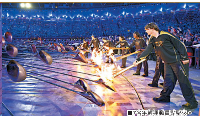
7名年輕運動員點聖火。