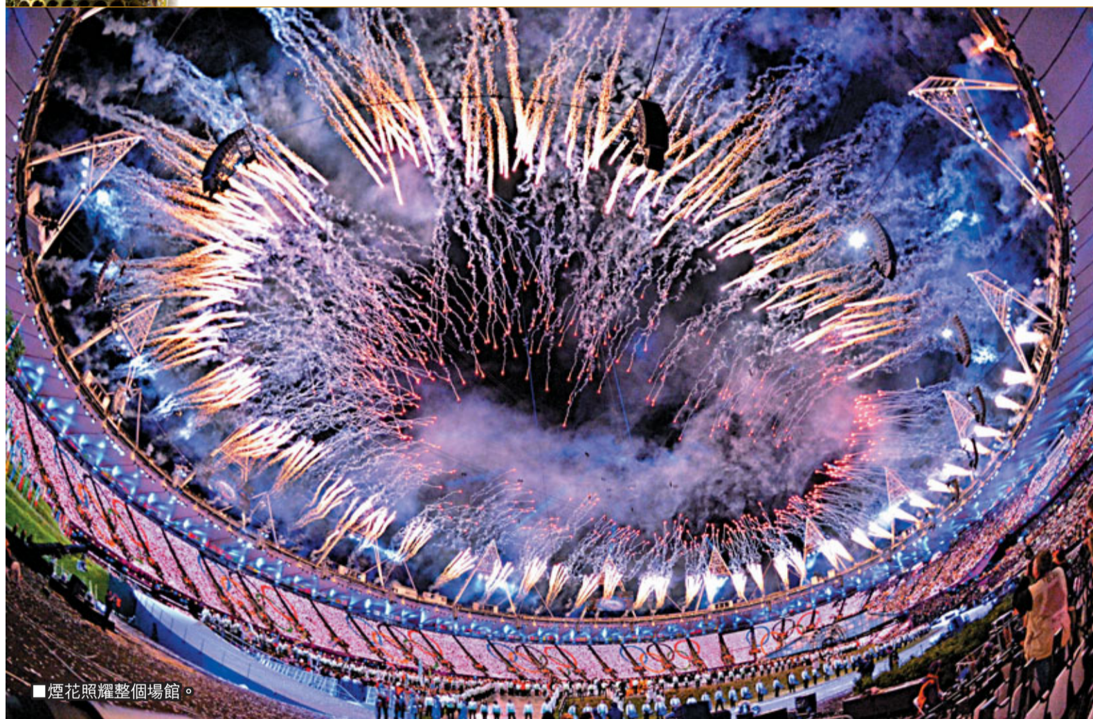
煙花照耀整個場館。