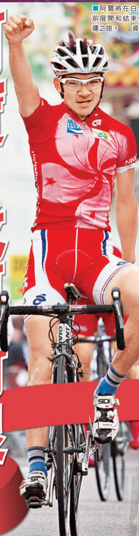
阿寶將在白金漢宮前展開和結束個人奧運之旅。 資料圖片