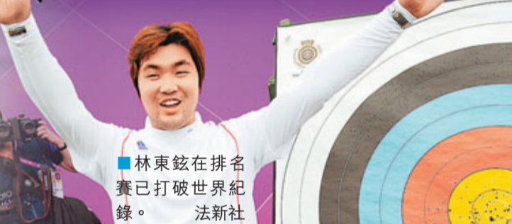
林東鉉在排名賽已打破世界紀錄。

首日排名賽結束，另外一位韓國箭手金法珉以1分之差緊隨在後，吳鎮赫則以690分排第3位。3位韓國箭手皆對此項目金牌志在必得，林東鉉更信心滿滿表示，要帶領韓國奪金。 ■香港文匯報記者 黃舒慧