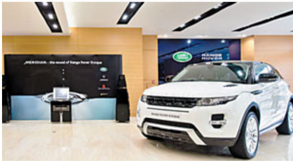
■兩大英國品牌Land Rover和Meridian首次在香港合作舉行試聽會，並在陳列室展示一系列Meridian音響。

Meridian是英國頂級數位音源處理專家，採用獨有的數碼技術，產品質素為世界公認。兩大英國品牌近年開始在汽車音響上合作，攜手在車廂帶來最優質的聽覺感受。Range Rover Evoque是第一輛採用Meridian的Land Rover汽車，基本型號採用Meridian音響系統，輸出380W。車主更可選擇升級至Meridian 環迴音響系統，輸出825W，在汽車的每一個角落盡享澎湃震撼的多聲道的極致音效。