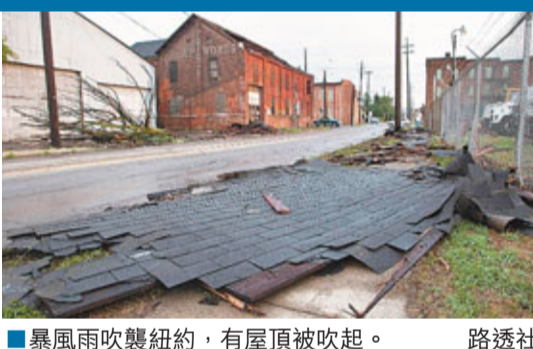
■暴風雨吹襲紐約，有屋頂被吹起。

中西部日前雖有微陣雨，但未能阻止農作物進一步損失。氣候專家富克斯指，部分偏遠地區水位因而下降，供水機構正商討制水。他稱，旱災將持續數月，將影響殺肉、家畜飼料、酒精及食品生產，料會拖累出口。