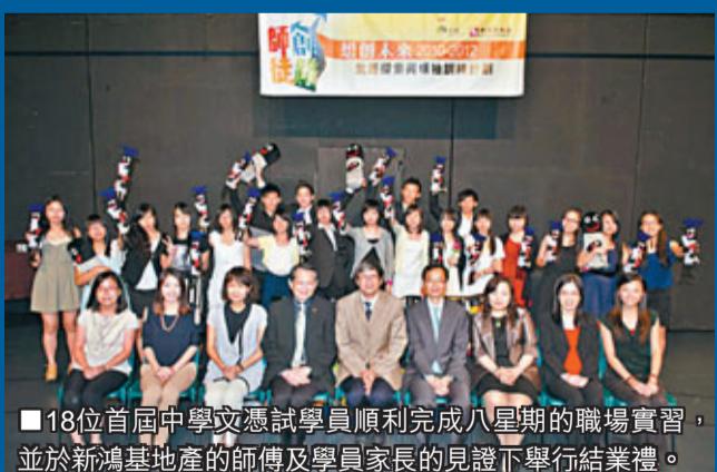
■18位首屆中學文憑試學員順利完成八星期的職場實習，並於新鴻基地產的師傅及學員家長的見證下舉行結業禮。

新鴻基地產(新地)與突破機構合辦的師徒創路學堂之「想創未來」計劃，以一對一的師徒形式，由新地員工擔任師傅，透過工作實習為首屆中學文憑試考生提供工作上的指導。日前，「想創未來」計劃舉辦結業禮，慶祝學員順利完成由新地提供的職場實習，並鼓勵他們面對中學文憑試放榜，展開人生新一頁。