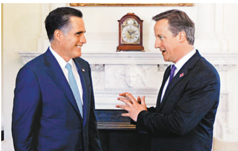
羅姆尼分別與卡梅倫(上圖右)及文立彬(下圖右)見面。