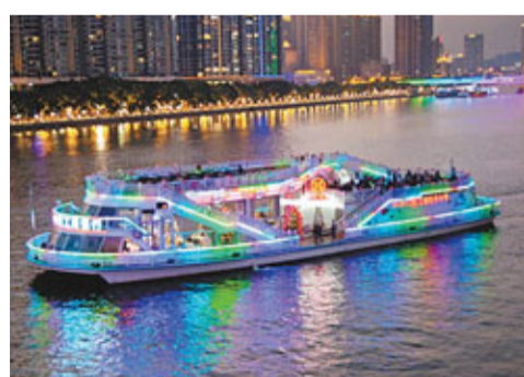
「水上郵局」不僅有廣州本地特色，遊客還可以在明信片船票上加蓋獨具特色的紀念戳並寄出。

網上海具特色的紀念戳並寄出。珠江航運對明信片船票的前景非常樂觀，預計首年將寄出80萬至100萬份。