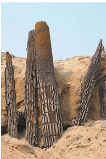
26日，考古專家首次發現秦始皇時期大型木橋。

據悉，渭河上發現的木橋，其殘存的立木最長的有9米高，胸徑在30到50厘米，橋樑寬度約為18.5米，專家由此推測其橋面的寬度應達20米。