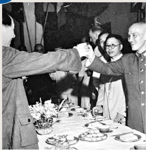
1945年重慶談判期間，毛澤東與蔣介石相互敬酒。

1945年抗日戰爭勝利後，蔣介石邀請毛澤東到重慶共商國家大事。當毛澤東到達重慶的當天晚上，蔣介石舉辦了一個小型歡迎宴會。毛澤東與蔣介石至少有十幾年沒有見過面。上一次見面可能是在廣州，那時蔣介石是國民革命軍的統帥，毛澤東則以國民黨員的身份代理國民黨中央宣傳部長。一年後，隨着國共兩黨的決裂，兩個人從此成為政治上和軍事上的對手，他們率領各自的武裝力量進行的較量，每一刻都關係着各自的生死存亡。因此，即使毛澤東來到蔣介石面前，國共雙方的高級官員們還是感到他們握手的那一瞬間有點不可思議。因此時兩人的威望都達到了前所未有的高峰。